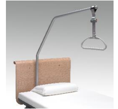
Søsterhjelp inkl. håndtak