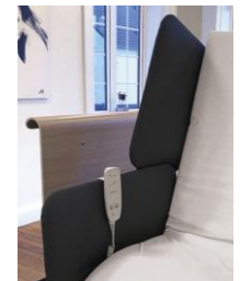
Sengehestpolstring (kort modell)