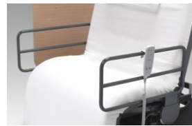
Sengehest i metall (midtdel)