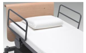
Sengehest i metall (ryggdel)