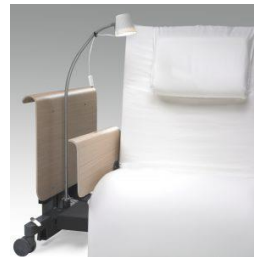
Lampe montert på seng