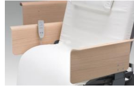
Sengehest i eikefinér (midtdel)