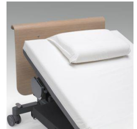
Pute i termoelastisk skum