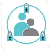
helhetlig og sikker