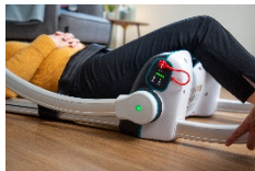
Lys som indikerer riktig montering