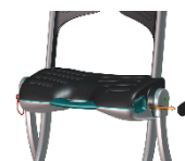
Praktisk oppbevaring av fjernkontroll