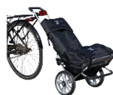
Sykelbrakett for transportvogn